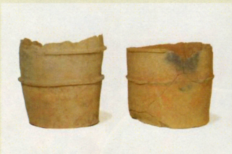
天理山3号墳 円筒埴輪