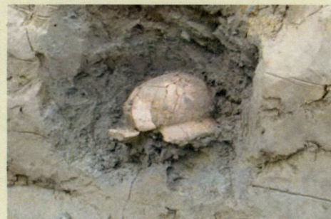
門田遺跡 土師器甕