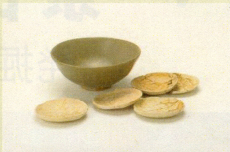
門田遺跡 青磁椀・土師皿