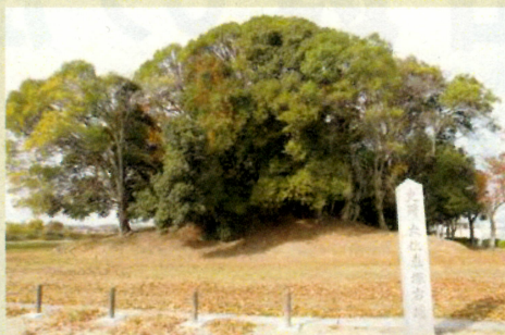
大住車塚古墳 (史跡指定50周年パネル展示)